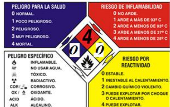
Etiqueta de identificación del producto